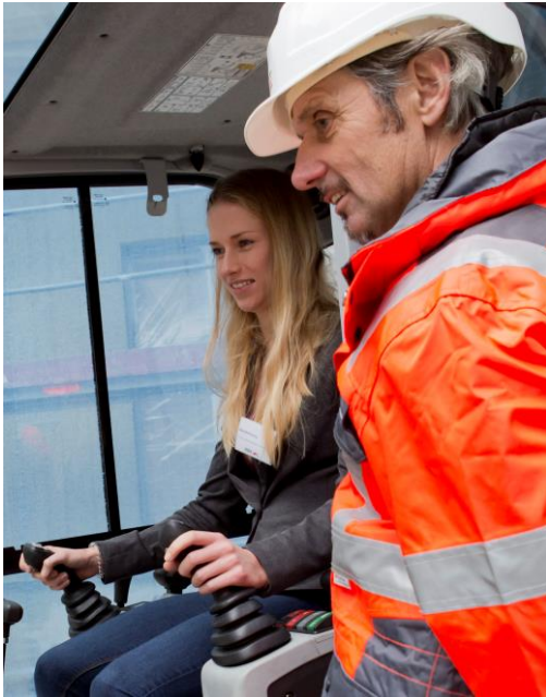
Abbildung 5: Aktive Betreuung