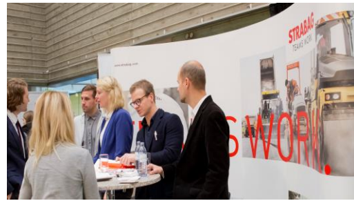
Abbildung 4: STRABAG Messestand