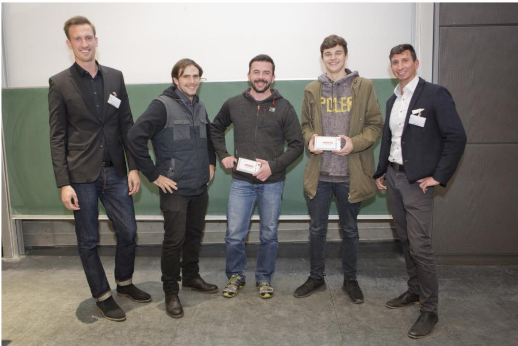
Abbildung 6: Siegerfoto