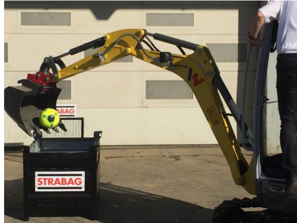
Abbildung 1: Übung eins des Geschicklichkeitsbewerbs